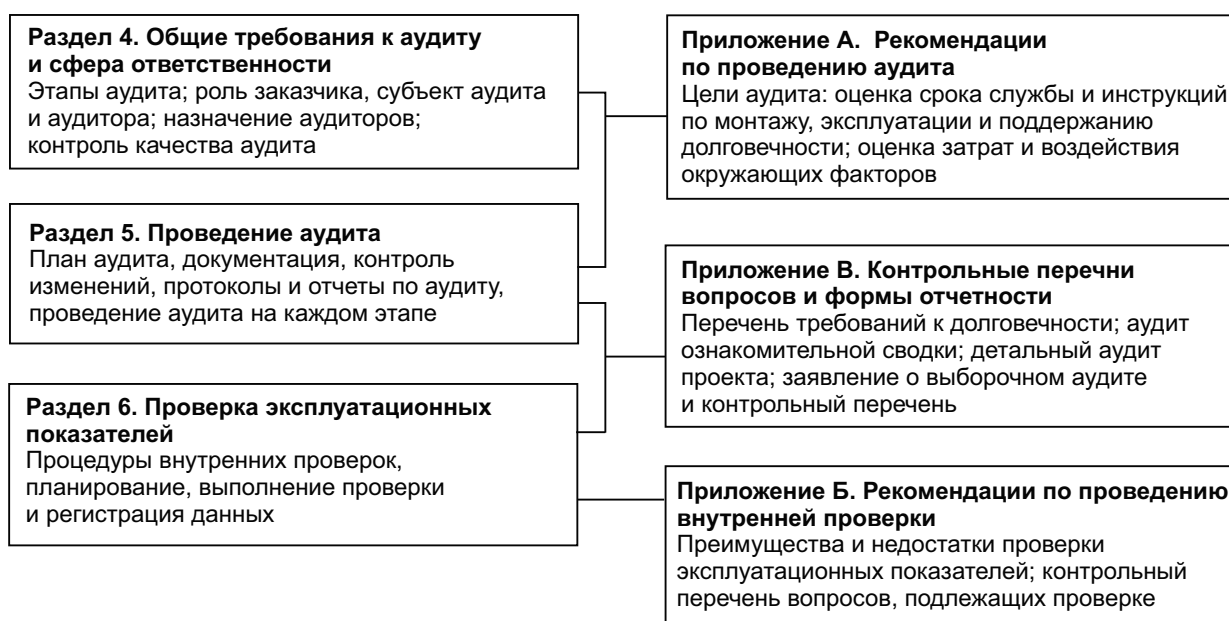
Рисунок 2 — Краткий обзор стандарта

На рисунке 2 представлены основные аспекты, рассматриваемые стандартом.